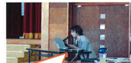
宜野座高校の取組発表