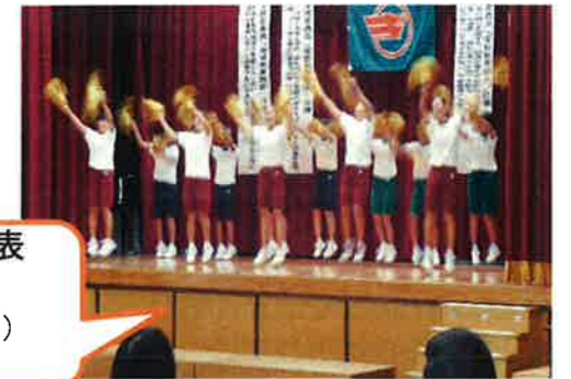
宜野座中学校の発表