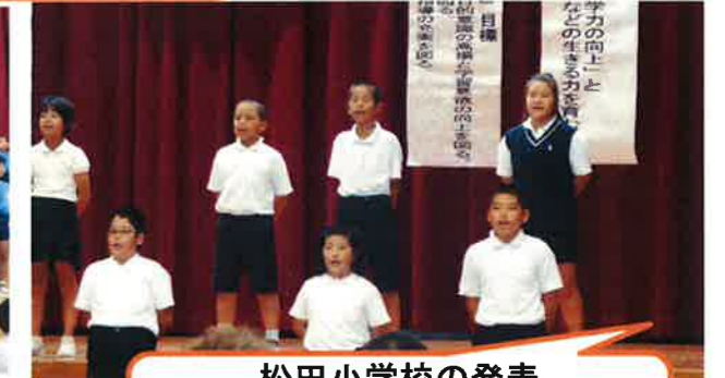
松田小学校の発表