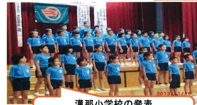
漢那小学校の発表